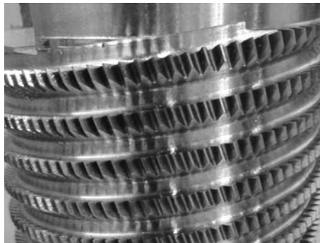
Werkstück mit verdrehter Spannute